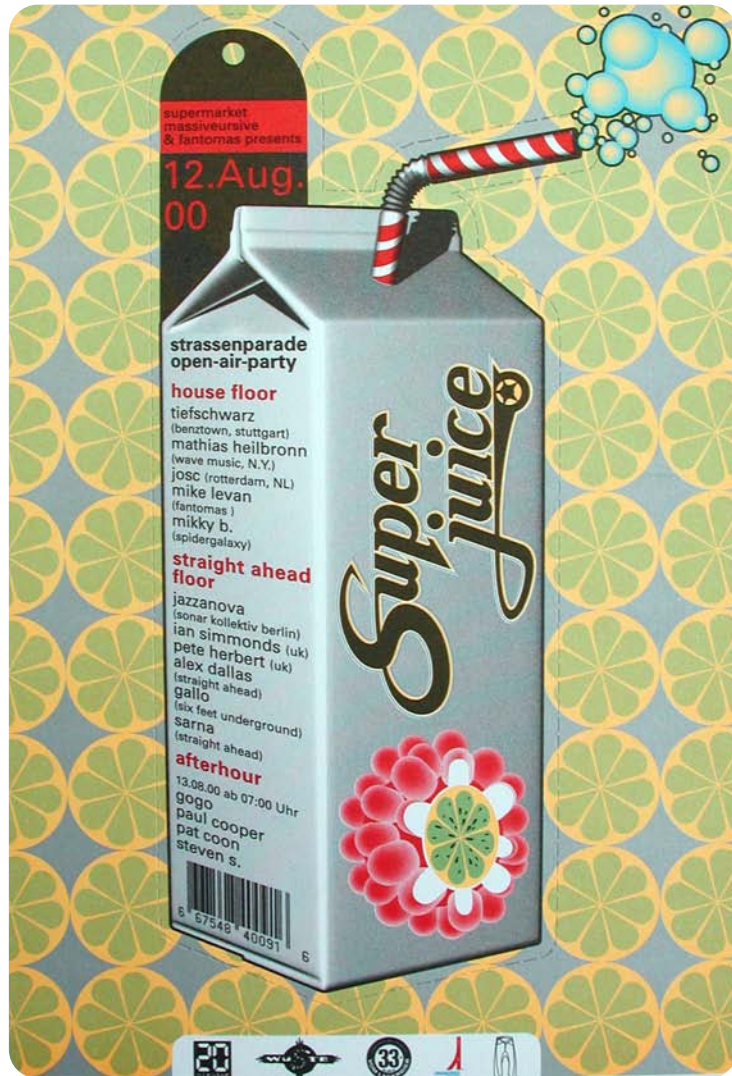
Superjuice Flyer 3D – MilchVerpackung, Illustration: D. Gregory