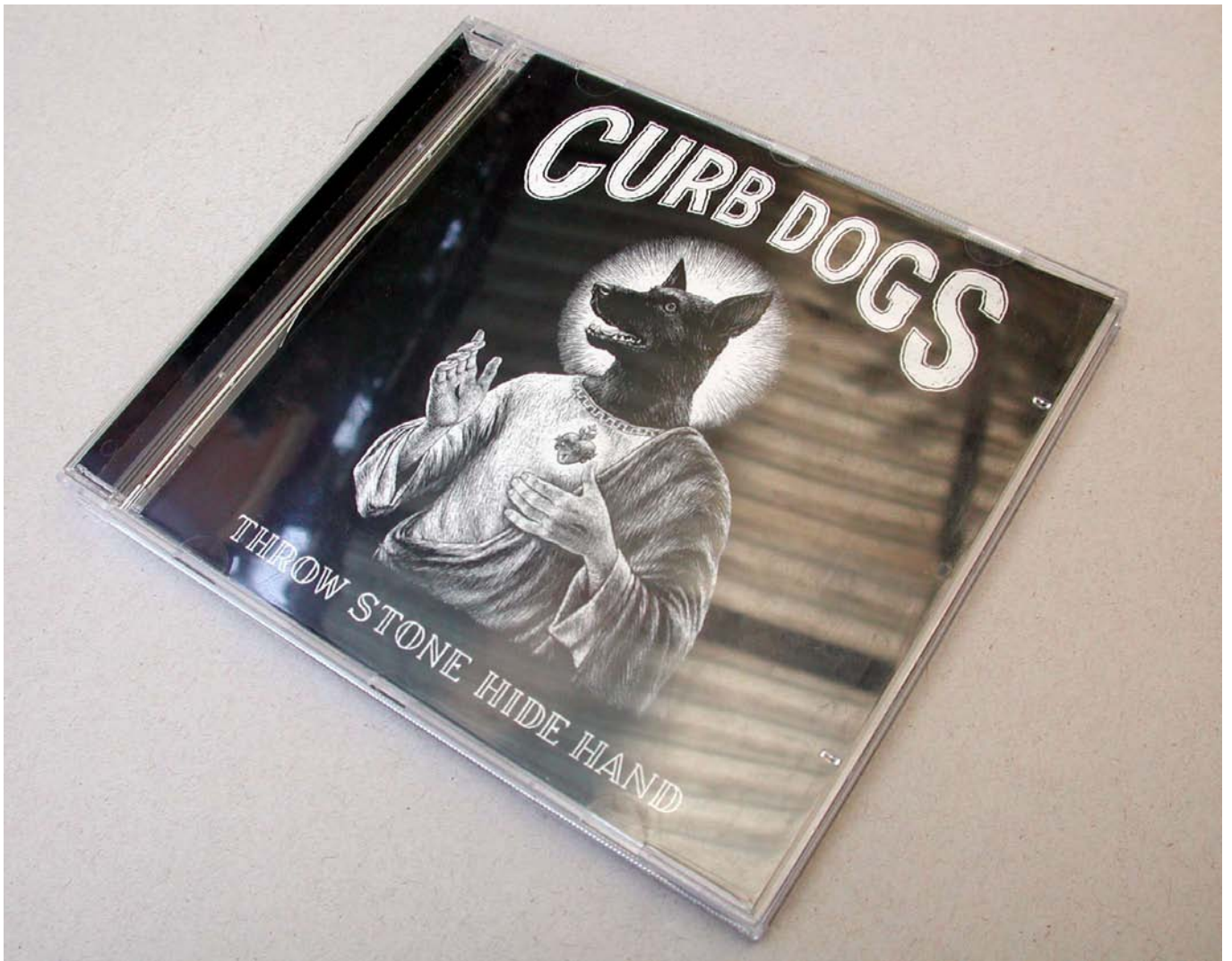
Curb Dogs CD- gestaltung Layout, Illustration: Thomas Ott