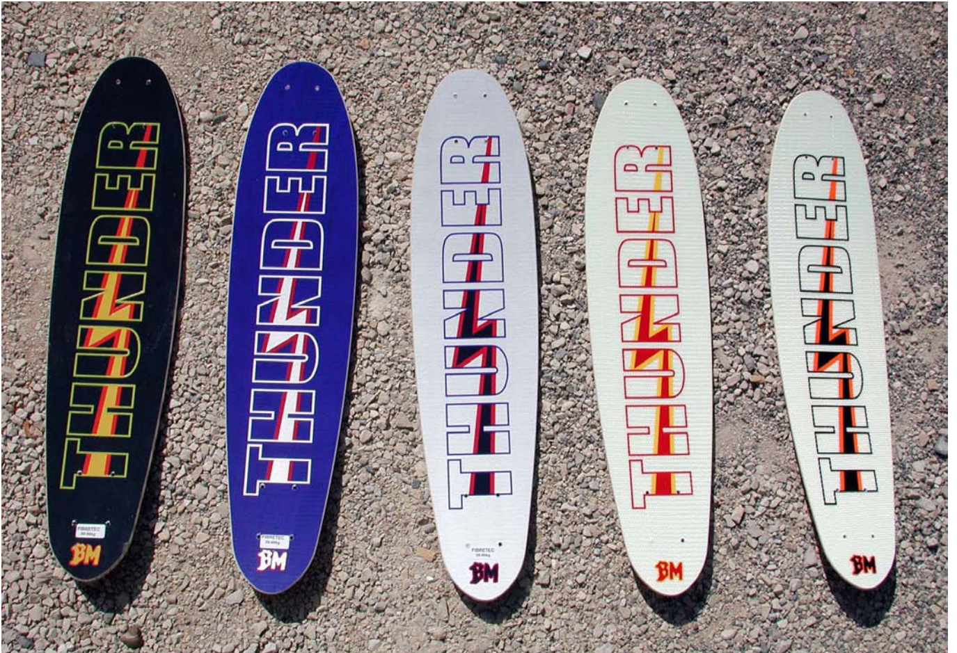
B&M Thunder Skateboarddesign Layout, Illustration