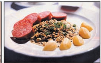
above: Bockwurst Sfr. 17.50 Left: Restaurant Wilder Man