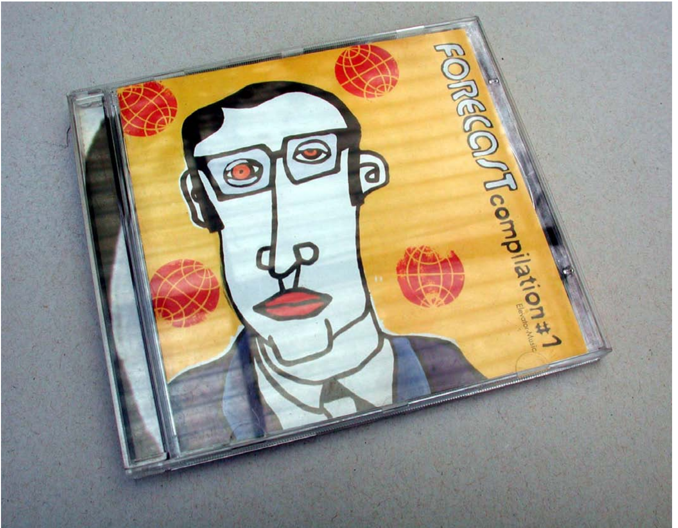
Forecast CD – gestaltung Layout, Illustration: Robi Insinna