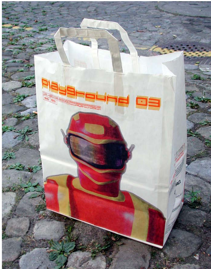
MIGROS Einkaufsack 3D – Illustration